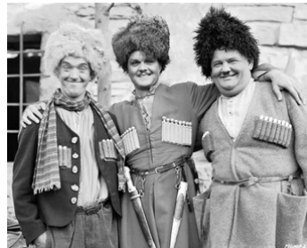
1930 LE CHANT DU BANDIT (The Rogue Song) de Lionel Barrymore avec Lawrence Tibbett