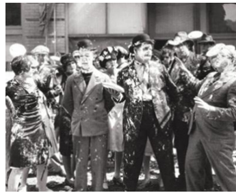
1927 LA BATAILLE DU SIÈCLE (The Battle of the Century) de Clyde Bruckman