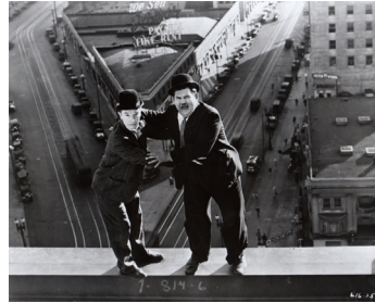
1928 VIVE LA LIBERTÉ ! (Liberty) de Leo McCarey