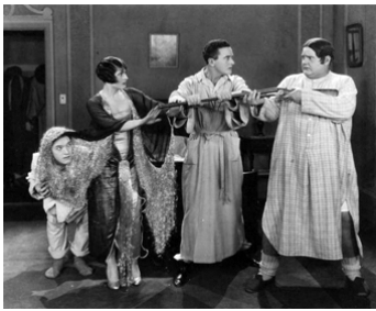
1926 EN PLEIN MÉLI-MÉLO (Slipping Wives) de Fred Guiol avec Priscilla Dean, Albert Conti