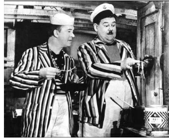
1940 LAUREL ET HARDY EN CROISIÈRE (Saps at Sea) de Gordon Douglas