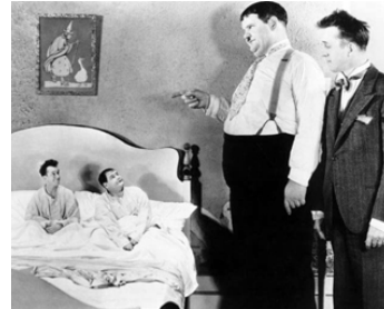
1930 LES BONS PETITS DIABLES (Brats) de James Parrott avec Laurel & Hardy