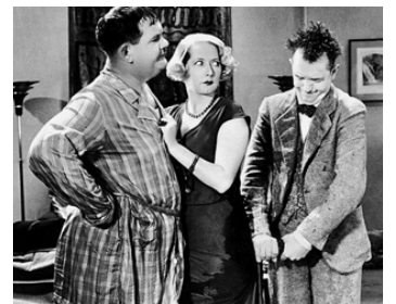
1933 LES COMPAGNONS DE LA NOUBA (Sons of the Desert) de William A. Seiter avec Mae Bush