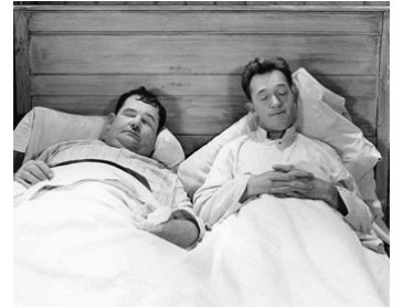
1929 ILS VONT FAIRE BOOM ! (They go boom) de James Parrott