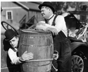
1932 MARCHANDS DE POISSONS (Towed in a Hole) de George Marshall