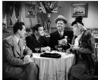
1943 LES ROIS DE LA BLAGUE (Jitterbugs) de M. St. Clair avec Robert Bailey, Douglas Fowley