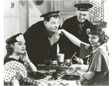
1936 C'EST DONC TON FRÈRE (Our Relations) d'H. Lachman avec Lona Andre, Iris Adrian