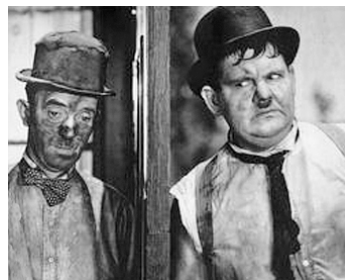
1933 LAUREL ET HARDY RAMONEURS (Dirty Work) de Lloyd French