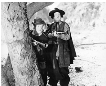
1944 LE GRAND BOUM (The big Noise) de Malcolm St. Clair avec Esther Howard