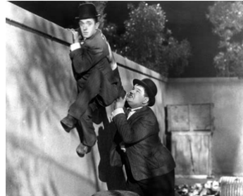
1929 LES DEUX CAMBRIOLEURS (Night Owls) de James Parrott