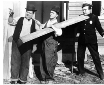
1928 LES CONSTRUCTEURS (The finishing Touch) de L. McCarey & C. Bruckman avec E. Kennedy