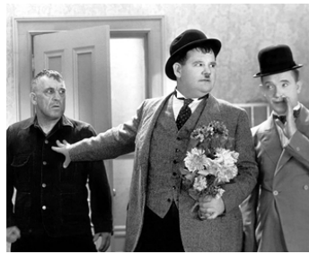
1934 LES JAMBES AU COU (Going bye-bye !) de Charles Rogers avec Walter Long