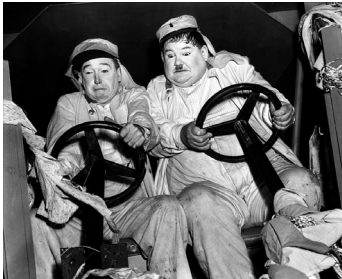
1939 LAUREL ET HARDY CONSCRITS (The Flying Deuces) d'A. Edward Sutherland