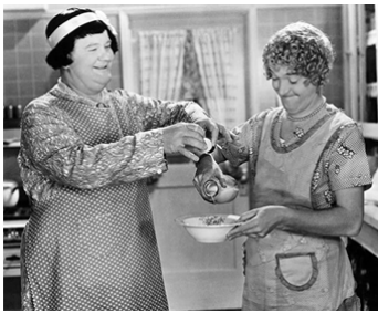
1933 LES JOIES DU MARIAGE (Twice Two) de James Parrott