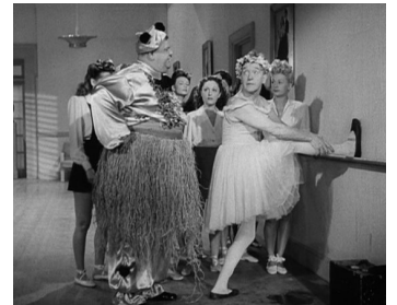
1943 MAÎTRES DE BALLET (The Dancing Masters) de Malcolm St. Clair