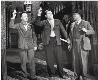
1930 LA MAISON DE LA PEUR (The Laurel-Hardy Murder Case) de James Parrott avec S. Blystone