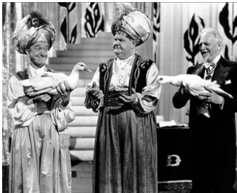
1942 FANTÔMES DÉCHAÎNÉS (A haunting we will go) d'Alfred L. Werker avec Dante