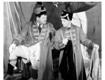
1932 PRENEZ GARDE AU LION ! (The Chimp) de James Parrott