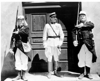
1931 LES DEUX LÉGIONNAIRES (Beau Hunks) de James W. Home avec Charles Middleton