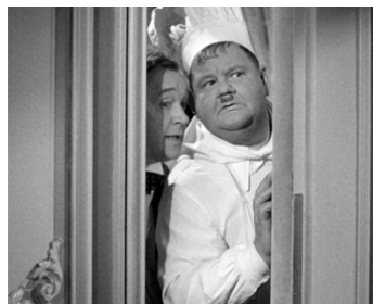
1944 LES CUISTOTS DE SA MAJESTÉ (Nothing but trouble) de Sam Taylor