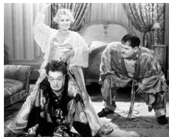
1932 LES DEUX VAGABONDS (Scram !) de Ray McCarey avec Vivien Oakland