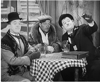
1934 LES ROIS DE LA GAFFE (The Fixer Uppers) de Charles Rogers avec Arthur Housman