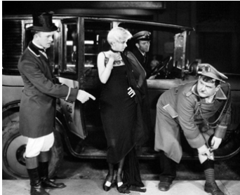
1929 SON ALTESSE ROYALE (Double Whoopee) de Lewis R. Foster avec Jean Harlow