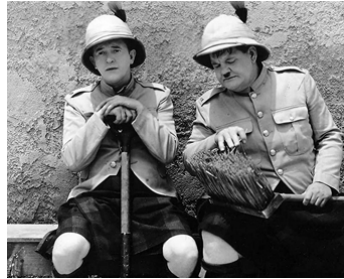
1935 BONS POUR LE SERVICE (Bonnie Scotland) de James W. Horne