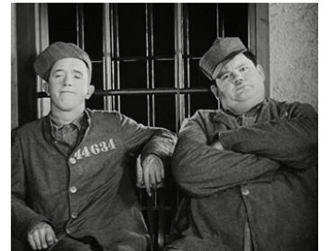
1931 SOUS LES VERROUS (Pardon us) de James Parrott