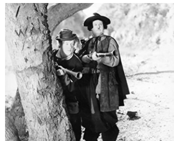
1933 FRA DIAVOLO (The Devil's Brother) de Hal Roach et Charles Rogers