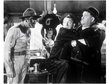
1941 QUEL PÉTARD ! (Great Guns) de Monty Banks avec Edmund MacDonald