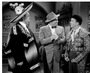
1945 LES TORÉADORS (The Bullfighters) de Malcolm St. Clair avec Richard Lane