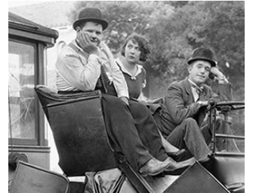
1930 LES DEUX BRICOLEURS (Hog Wild) de James Parrott avec Fay Holderness