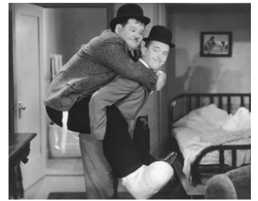
1934 LES JOYEUX COMPÈRES (Them thar Hills) de Charles Rogers