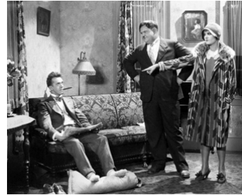
1929 C'EST MA FEMME (That's my Wife) de Lloyd French avec Vivien Oakland