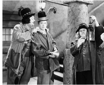
1936 LA BOHÉMIENNE (The Bohemian Girl) de James W. Horne et Charles Rogers