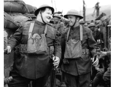
1938 TÊTES DE PIOCHE (Block Heads) de John G. Blystone